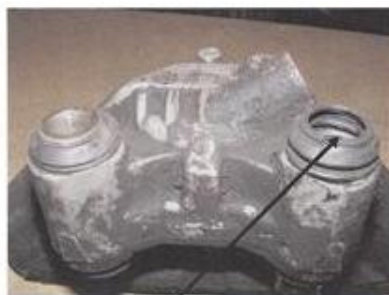
Beispiel: Führungshülse fehlt