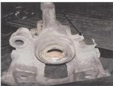
Beispiel: Ein Teil des Sattels ist abgebrochen