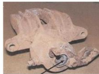
Beispiel: Rückstellfeder des Handbremshebels fehlt