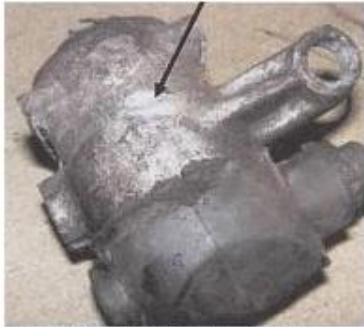
Beispiel: Der Sattel wurde beim Ausbau beschädigt (Bsp. durch Hammerschläge).